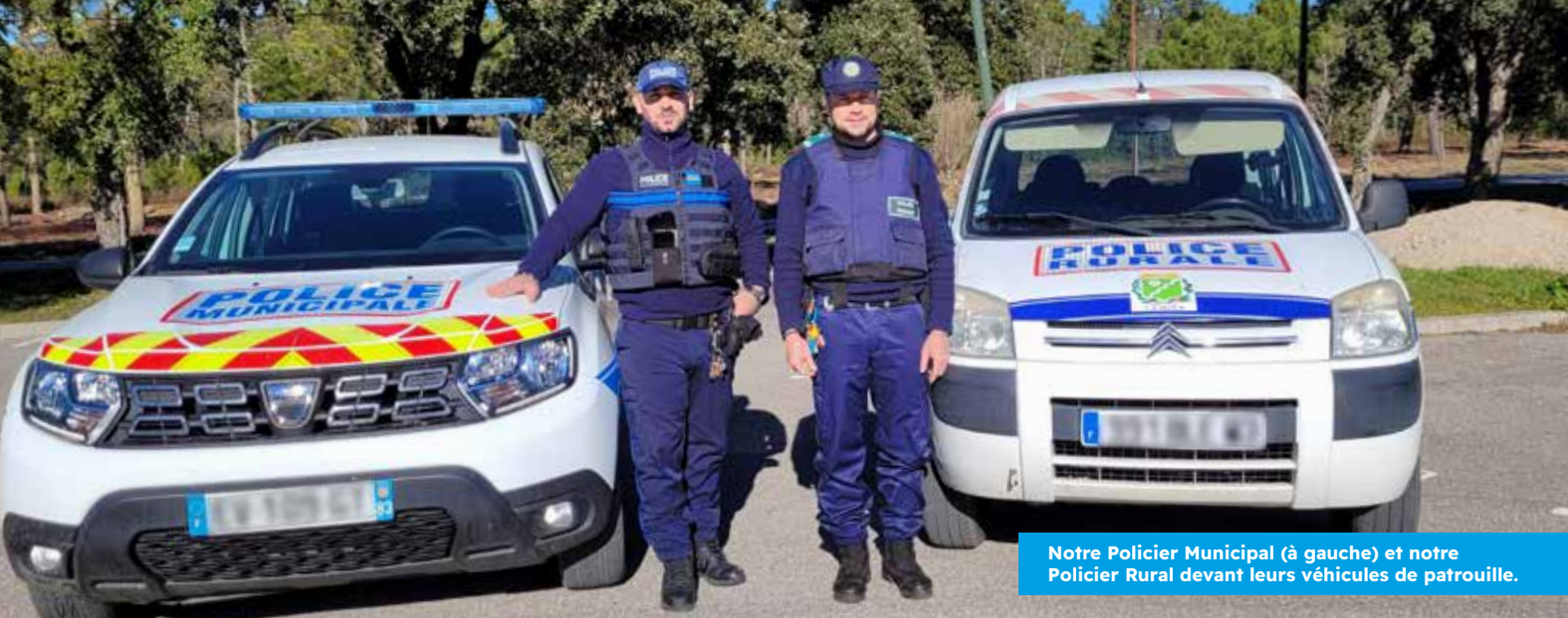
Notre Policier Municipal (à gauche) et notre Policier Rural devant leurs véhicules de patrouille.